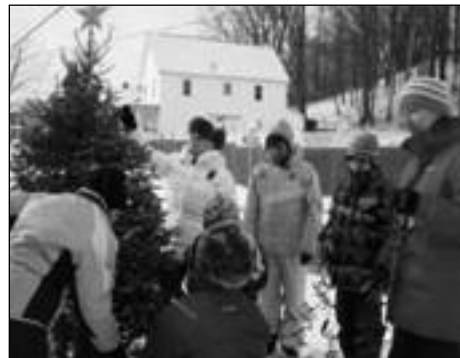
(Décoration du sapin avec les bénévoles. Décembre 2010)