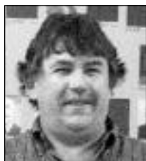
Paul Stuart Siège #01 Loisirs et Culture et Sécurité publique